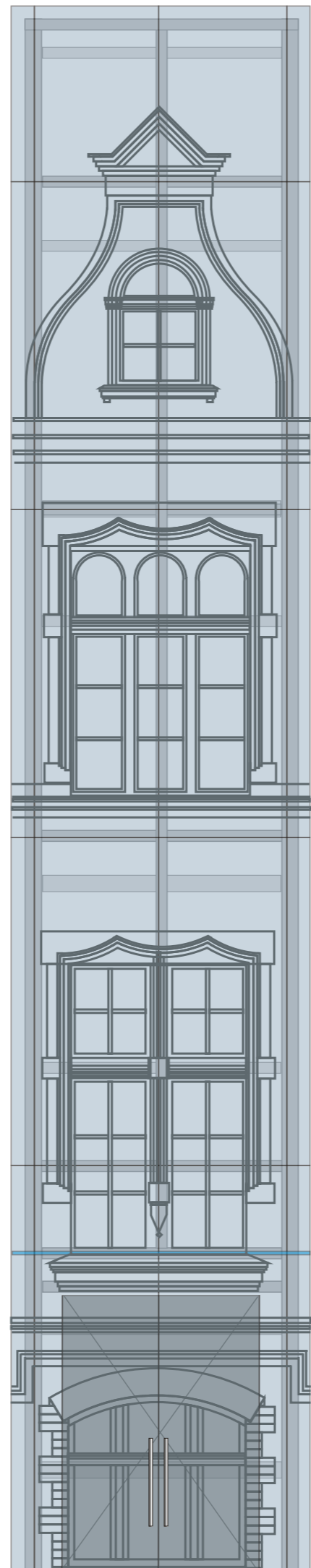
KŁAD ELEWACJI POŁUDNIOWEJ