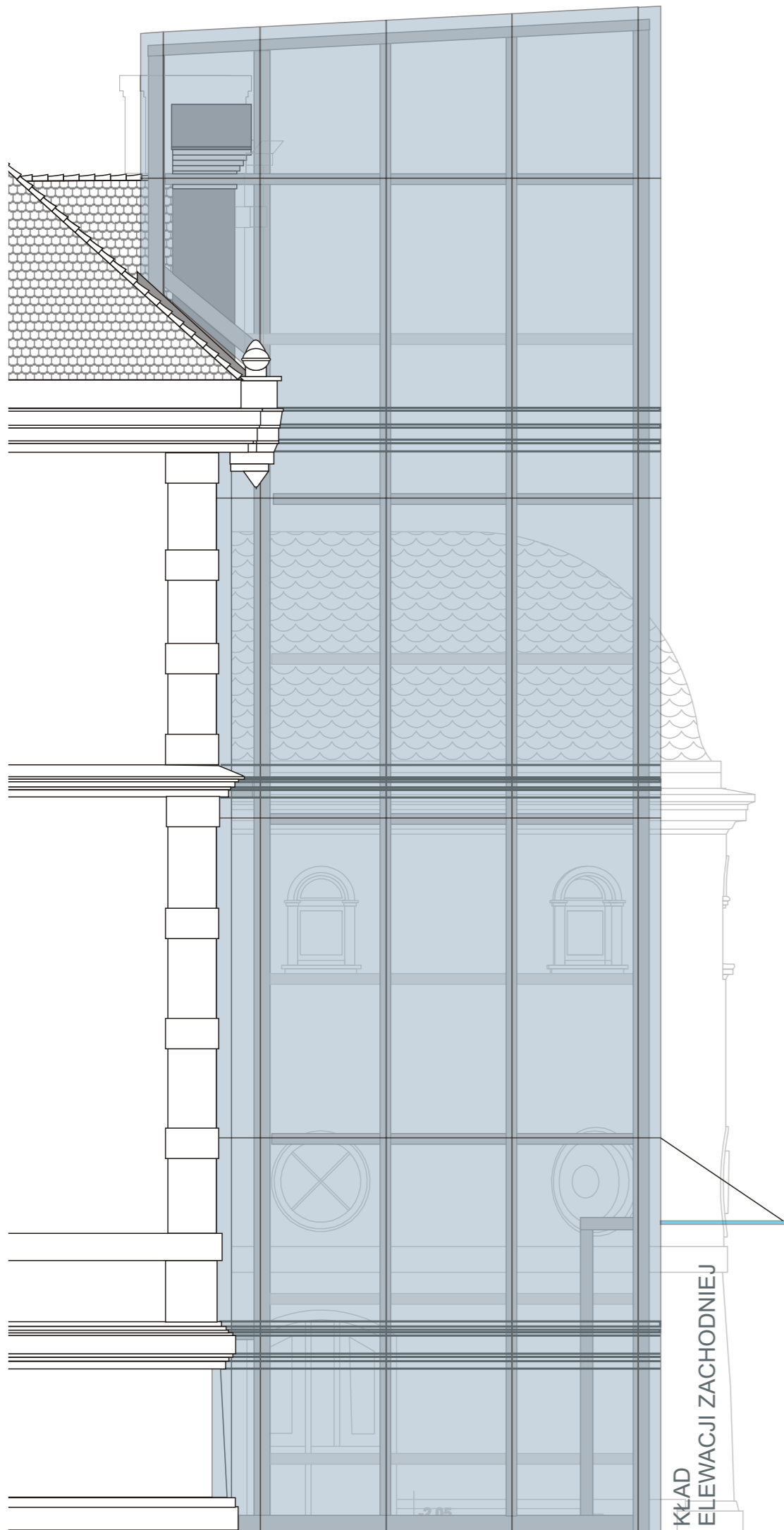
KŁAD ELEWACJI ZACHODNIEJ